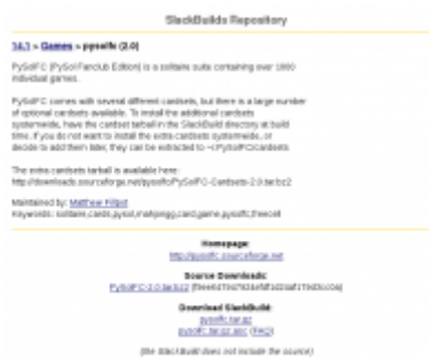
Figure 2 - Page Pysolfc des SlackBuilds

Bien, allons-y maintenant. La première chose à faire est d'atteindre SlackBuilds.org avec votre navigateur préféré. Dans la petite zone de recherche, en haut à droite, saisissez le nom de l'application que vous cherchez et juste à côté précisez la version de votre Slackware . Pour ce tutoriel, nous allons utiliser PysolfC pour Slackware14.1, il s'agit d'un paquet d'environ mille jeux. Dès que la recherche a abouti, vous êtes à pysolfc SlackBuild page (voir Fig 2).